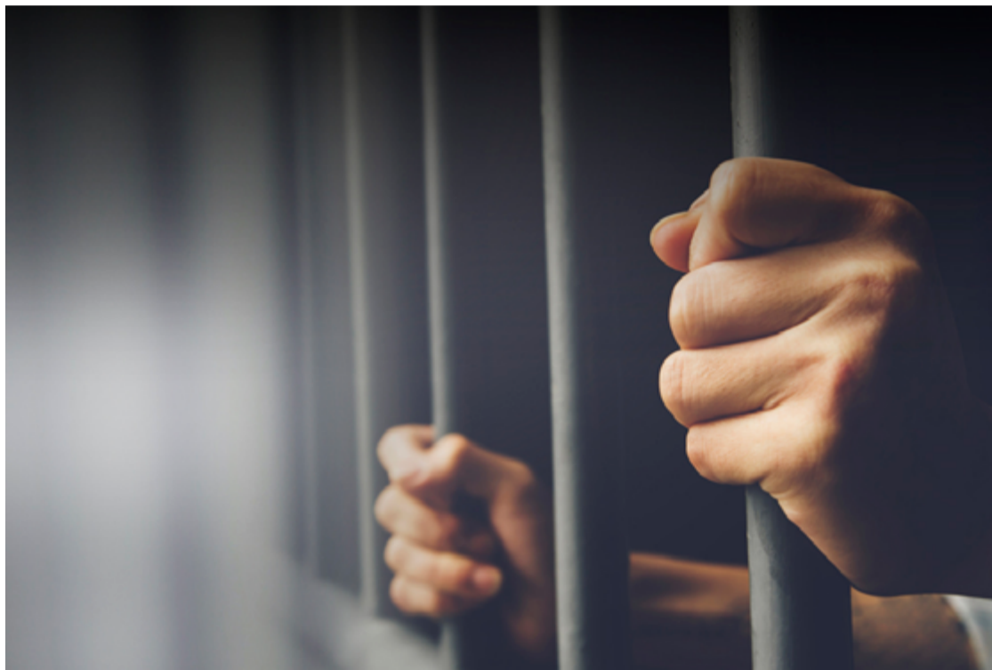
Réu não poderá recorrer em liberdade