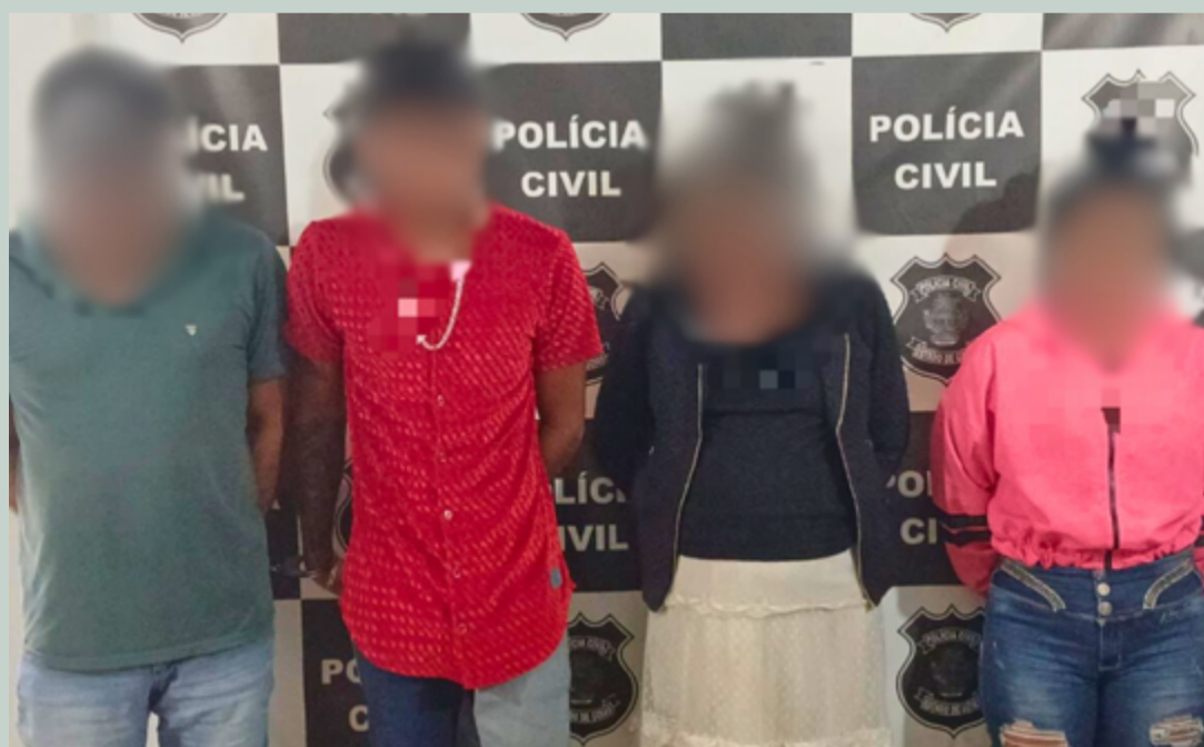
Os envolvidos na tentativa de fraude foram identificados como um homem de 59 anos, outro de 24 anos, uma mulher de 23 anos e outra de 76 anos

Os envolvidos na tentativa de fraude foram identificados como um homem de 59 anos, outro de 24 anos, uma mulher de 23 anos e outra de 76 anos. De acordo com as investigações, o grupo atuava de maneira organizada, com as duas mulheres entrando na agência bancária e se passando por beneficiárias do INSS, enquanto os dois homens permaneciam do lado de fora, dando suporte