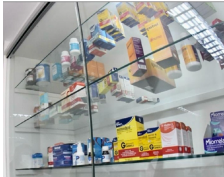
Conforme IBGE, venda de artigos farmacêuticos e veículos puxaram a alta varejista goiana

A Pesquisa Mensal de Comércio (PMC) gera indicadores que permitem monitorar o comportamento conjuntural do comércio varejista no país, analisando a receita bruta de revenda das empresas formalmente constituídas com 20 ou mais empregados, e cuja atividade principal é o comércio varejista.