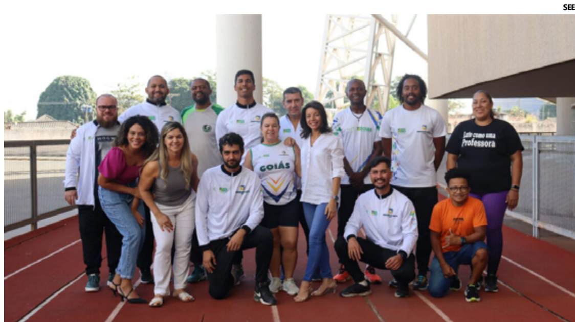
O treinamento de professores aconteceu no Centro de Excelência do Esporte, em Goiânia

O treinamento, que reuniu educadores de diversas partes de Goiás, teve como objetivo prepará-los para atuar em sete modalidades paralímpicas, que serão trabalhadas nos núcleos esportivos. As oficinas, mi-