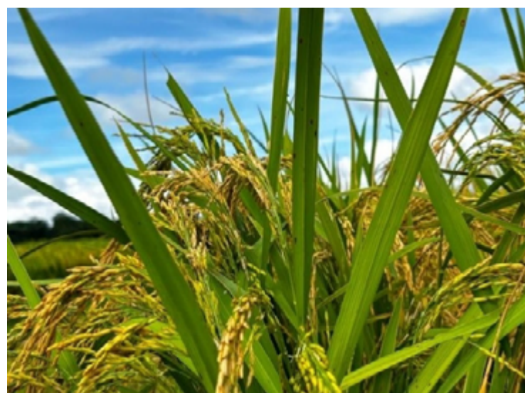
Produção de arroz em Goiás deve crescer 17,7%, acima da média nacional de 1,9%

Entre as grandes regiões do Brasil, o Centro-Oeste se destaca, sendo responsável por quase metade da produção de cereais, leguminosas e oleaginosas do país, com um volume de 144,5 milhões de toneladas, equivalente a 48,5% do total nacional.