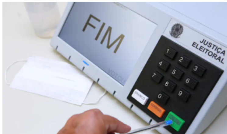
Prazo para o registro presencial se encerrou às 19h desta quinta-feira

O registro é um procedimento por meio do qual a legenda informa à Justiça Eleitoral todos os dados exigidos sobre uma candidatura