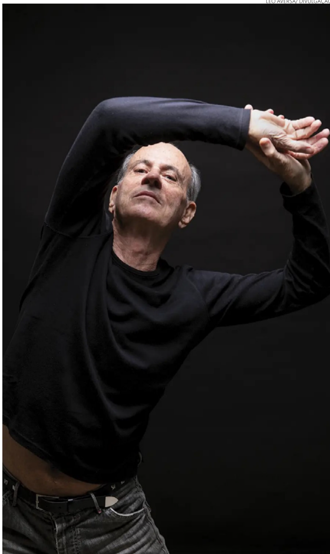
Artista coloca bloco na rua em apresentação que mostra vitalidade

Secos e Molhados, ora, dinamitam os pilares do conservadorismo desde 73. Seu vocalista, Ney, aparecia na televisão maquiado. Mostrava a delícia de ser você mesmo. Não bastasse tamanha afronta à família