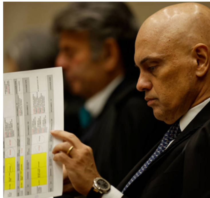
Alexandre de Moraes: atos questionados no julgamento de processos

Sobre possível irregularidade em procedimentos dos dois órgãos enquanto Moraes atuava tanto no TSE quanto no Supremo, o gabinete do ministro nega incorreção e afirma que “todos os procedimentos foram oficiais, regulares e estão devidamente documentados nos inquéritos e investigações em curso no STF, com integral participação da Procuradoria-Geral da República”.