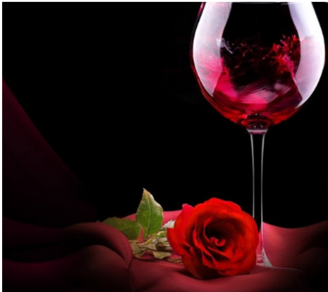
Relação entre poesia e vinho nasce em uma garrafa

Este tempo que a política imprime a nossa nova realidade. Temos esta missão de destacar, sublinhar e trazer à memória aquilo que pertence à nossa identidade, sublinhar o significado desse nosso mundo pessoal, social e cultural, missão que cabe olhar para dentro; é isso que tenho feito, percebendo o agora. E é muito curioso perceber na solidão, a importância da janela aberta, sim, uma simples janela que nos permite olhar para fora, preserva nossa vida, é como vinho armazenado em tonéis de carvalho. Torna o Sol amigo, mais próximo e sincero. Porque a vida e o amor querem o Vinho, exigem esse tempo e esse vagar não é uma coisa imediata.